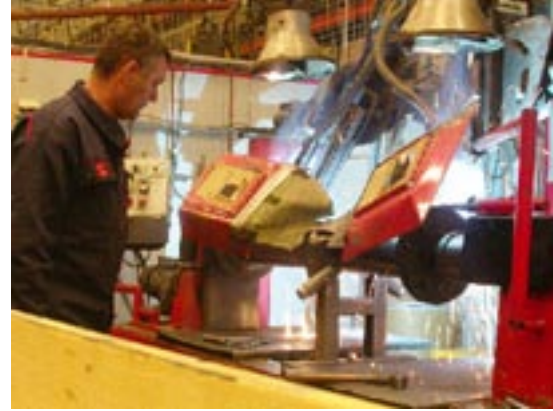
T v robotsvetsning Under t v bockning av detaljer.