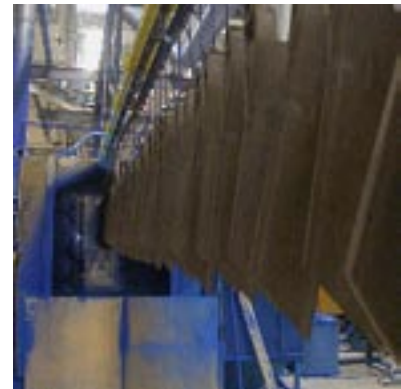
Ovan: Detaljer på väg till i blästring. T h på väg till målning.