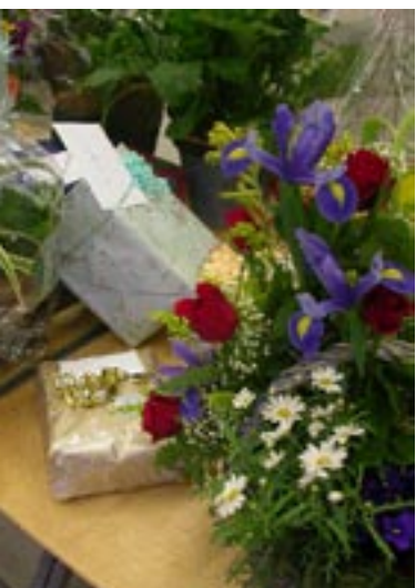
Gåvor och lyckönskningar.