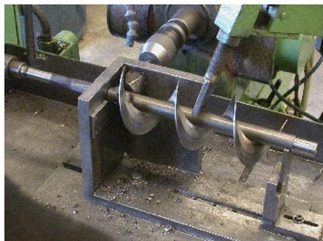
Längst t v. Snäckskruvar till- verkas av metall- band. T v: Axeln monteras