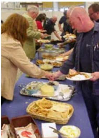
T h är det dags för lunch.