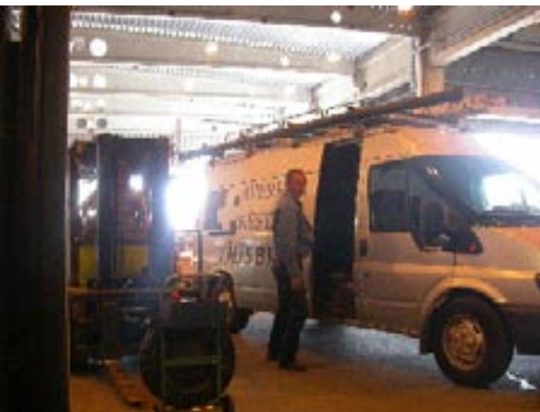
T v och ovan: Order tas emot, packas och levereras, dels till de egna service- bilarna, dels med lastbilstransporter till kunder och återförsäljare.