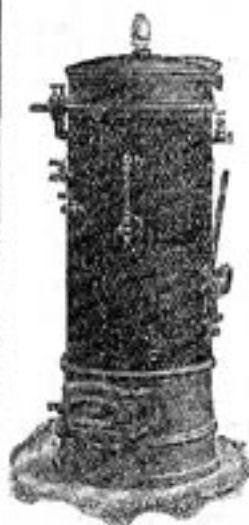
ELDGRYTA om 2 kv. eldyta