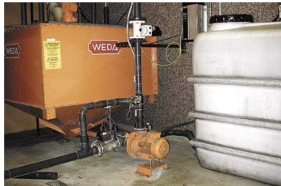
Gris nr 4 2004

Sommaren 1999 byggde de om det befintliga grisningsstallet. De ändrade från 24 till 32 boxar, samtidigt som inredningen byttes ut mot Infomatics så kallade Skånebox. Golven åtgärdades och det blev upphöjt spaltgolv över gödselrännan. Vid övertagandet fanns ca 70 suggor, men redan tidigt fanns