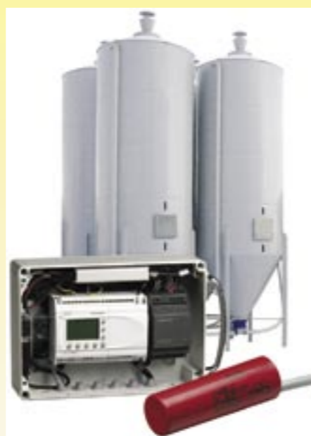
Givaren och uppringningsautomatiken till den intelligenta silon.

Att tillverka foder kostar ungefär lika mycket i de flesta europeiska länderna. Det är distributionen som är billigare söderut och dyrare här uppe i norr. När systemet med au-